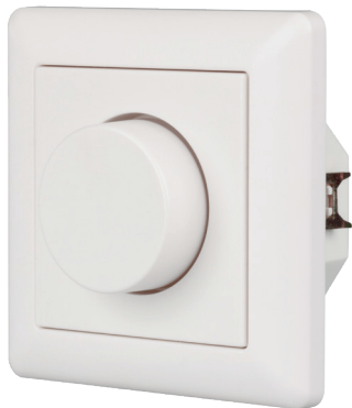
022155 Панель Rotary SR-2836N-A-RF-IN