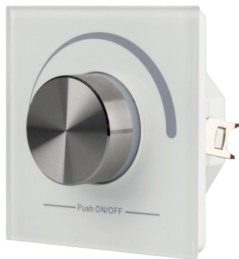
022516 Панель Rotary SR-2836N-B-RF-IN